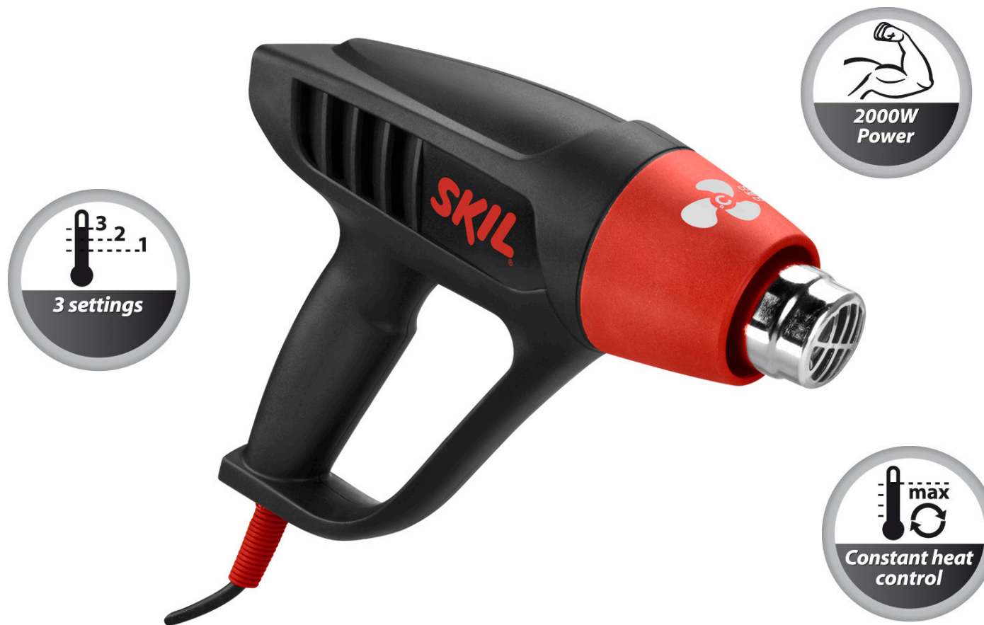
Pistol aer cald cu 3 nivele de temperatura, model 8003