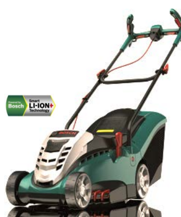
ROTAK 37 LI