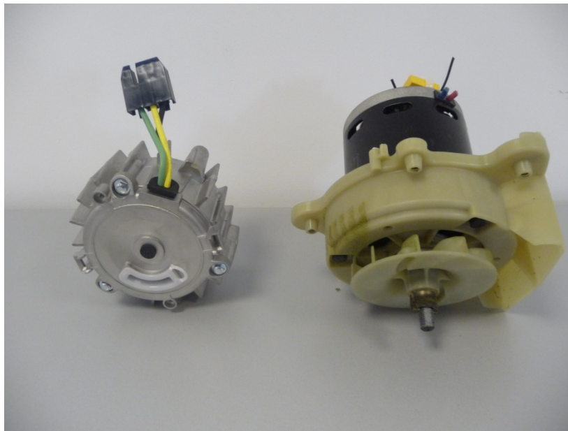
Motor fara perii