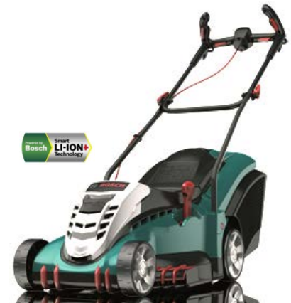
ROTAK 43 LI