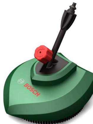
PC2 Sistem de curatare