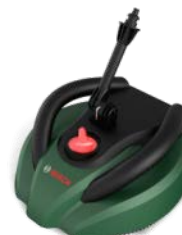
Sistem de curatat Head Super