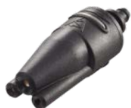
Duza 3 in 1