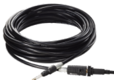
Furtun de evacuare 10m