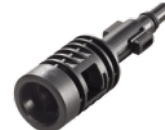
Adaptor pentru accesorii Aquatak