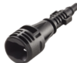
Adaptor pentru accesorii Kärcher