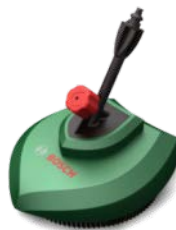
Sistem de curatat Head Deluxe