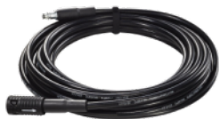
Extensie de furtun 6m