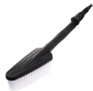
Perie de curatat