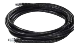
Furtun presiune inalta 6m