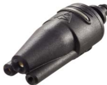
Duza Jet 3 in 1