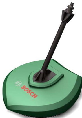
PC1 Sistem de curatare