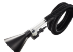
Duza de aspiratie