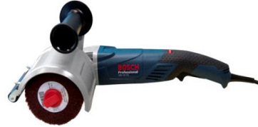
Mașină de satinat GSI 14 CE Professional