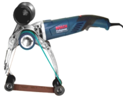
Șlefuitor pentru țevi GRB 14 CE Professional