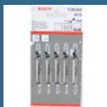
BOSCH T101AO Set 5 panze Clean for Wood 82 mm