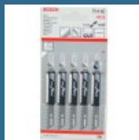
BOSCH T111C Set 5 panze Basic for Wood 100 mm