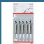
BOSCH T101D Set 5 panze Clean for Wood 100 mm