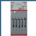
BOSCH T119BO Set 5 panze Basic for Wood 83 mm