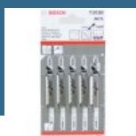
BOSCH T101B Set 5 panze Clean for Wood 100 mm